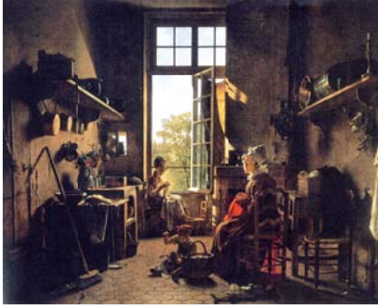
Martin Drolling, Intérieur d'une cuisine , 1815.

Dans cette cuisine, la femme se tient là avec sa fille, non pour la chaleur de la cheminée (la fenêtre est grande ouverte), mais pour la convivialité qui y règne.